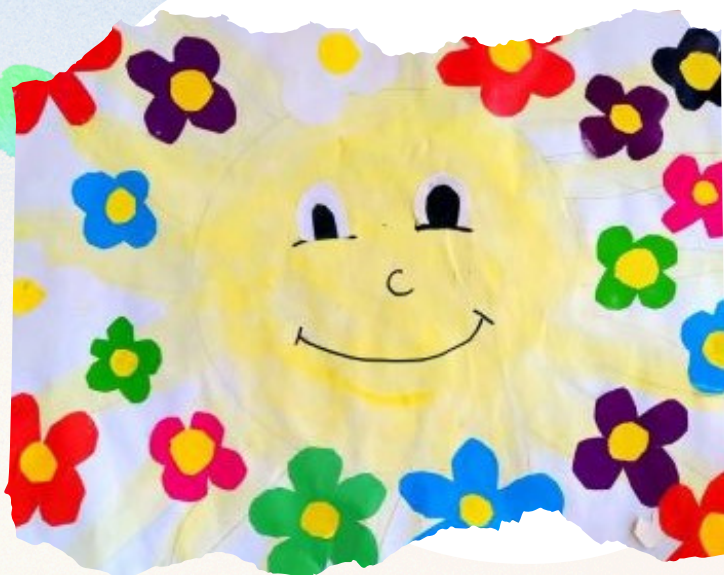
Викторија Нешет III-4