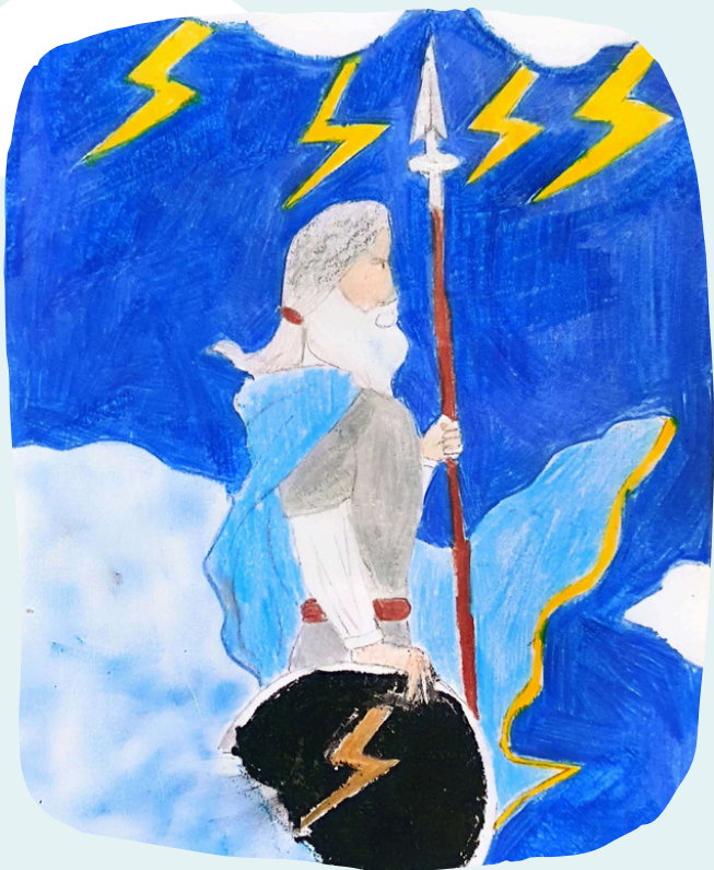
Маџа Буљутић VI-3