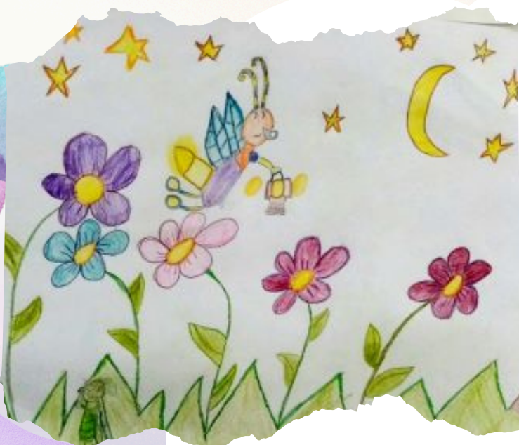
Миџра Траиловић II-4