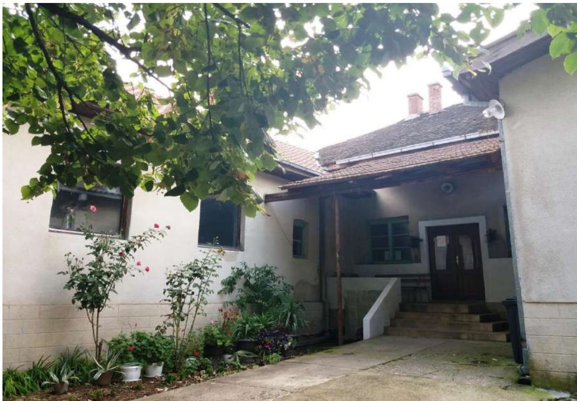
Школска зграда у Буковској

Школска зграда у Буковској је веома стара, али је августа 2013. године урађена реконструкција крова школе и уз друге радове сада су створени услови за организовање васпитно-образовног рада за све ученике овог подручног одељења. У школи се налази шест класичних учионица и једна специјализована учионица. У школском дворишту се налази зграда са ђачком кухињом и салом за физичко васпитање. Терен за мале спортове је асфалтиран, двориште је ограђено. Грејање је пећима на чврсто гориво, а водом се снабдева из сеоског водовода.