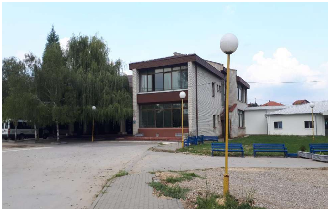
ОШ„Угрин Бранковић“ Кучево