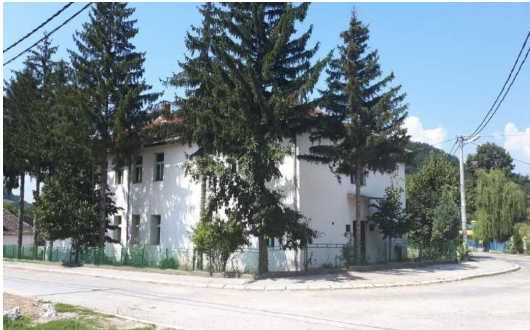
Школска зграда у Нересници

Школски простор у Нересници обезбеђује услове за рад у једној смени. Школа има 8 класичних учионица, две специјализоване, кабинет за информатику и библиотеку. У школском дворишту налази се зграда са школском кухињом и салом за физичко васпитање. Школско двориште је ограђено, има асфалтиран терен за мале спортове, и игралиште за децу предшколског узраста. Школа има централно грејање и користи сопствени водовод.