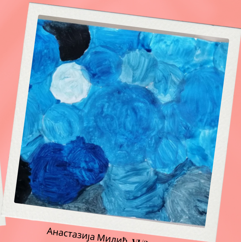
Анастасија Милић VI/2