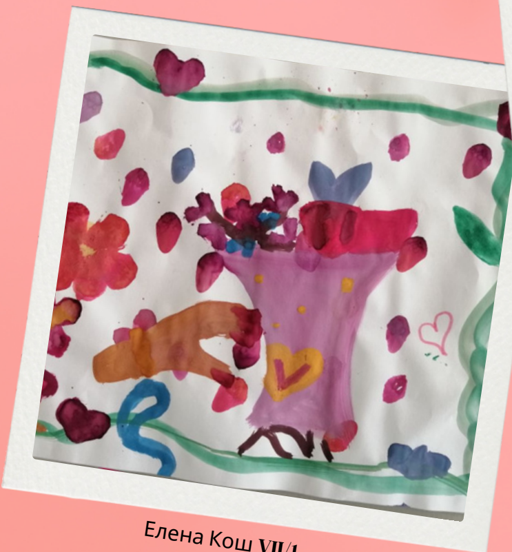
Елена Кош VII/1