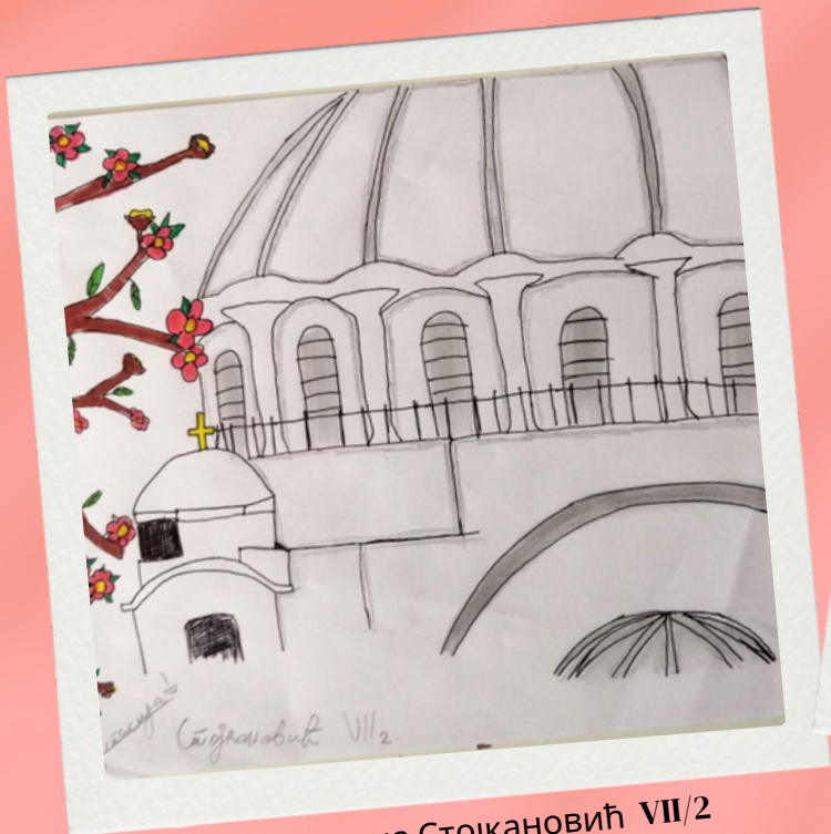
Анастасија Стојкановић VII/2