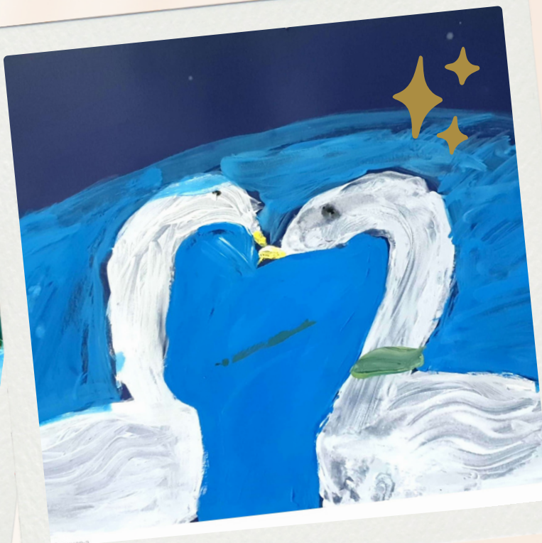
Сара Младеновић IV/3