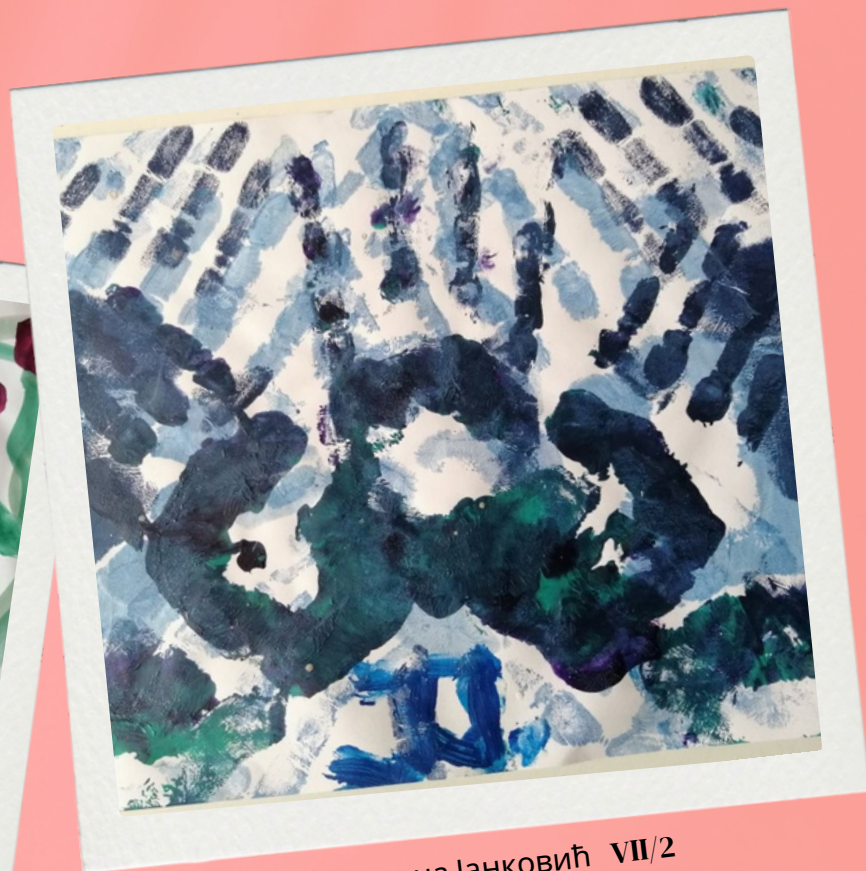
Јелена Јанковић VII/2