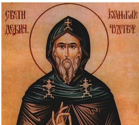
Јоаникије Други - први српски ПАТРИЈАРХ

ЦРКВЕНЕ СТАРЕШИНЕ У КАТОЛИЧКОЈ ЦРКВИ СУ: ПАПА, НАДБИСКУП И БИСКУП.