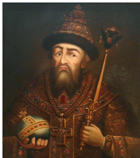
Иван IV Грозни – руски ЦАР