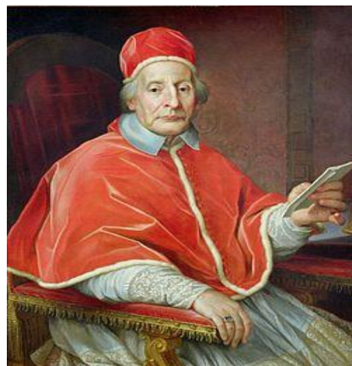
Клемент XII – римски ПАПА

~ПАТРИЈАРХ И ПАПА, ПОГЛАВАРИ ЦРКАВА, ИМАЛИ СУ ВЕЛИКИ УТИЦАЈ У ДРЖАВИ, СКОРО КАО И ВЛАДАР.