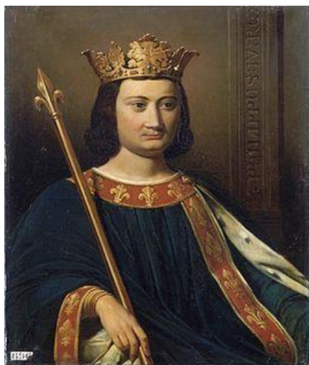
Филип IV Лепи – француски КРАЉ

Владари средњовековних европских држава су носили различите титуле: жупан, кнез, краљ, цар, деспот. Највиша титула је била царска.